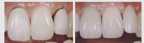
Metallkeramik-Kronen mit dunklen Rändern (links) und ästhetische Kronen aus reiner Keramik (rechts).

Wenn Sie wirklich schöne Zähne wollen, sollten Sie sich für Kronen und Brücken aus reiner Keramik entscheiden.