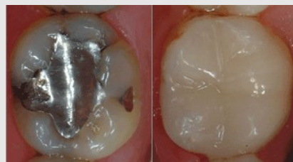
Bedenkliches Amalgam (links) oder verträgliche und ästhetische Füllungen aus Komposit oder Keramik (rechts)?

Als Kassenpatient haben Sie die Wahl zwischen Amalgam und kurzlebigen Kunststoff-Füllungen. Wenn Sie eine dauerhaftere und schönere Lösung wollen, sollten Sie sich für Kompositfüllungen oder für Keramikinlays entscheiden.