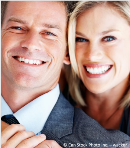
Selbstsicher mit gepflegten Zähnen

Dann werden Mund, Zähne und Zahnfleisch untersucht. Die Zahnbeläge werden angefärbt, um sie besser sichtbar zu machen und es wird die Tiefe der Zahnfleischtaschen gemessen.