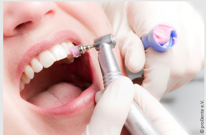
Die Professionelle Zahnreinigung wird von speziell ausgebildeten Prophylaxe-Fachkräften ausgeführt und ist eine lohnende Investition in die eigene Gesundheit.

Sie ersparen sich oft Kronen, Implantate und Zahnfleischoperationen.“